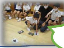
工事の信号見たことある!