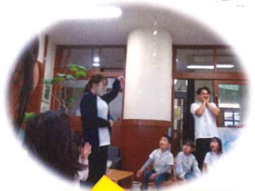
ポケットに入ってたよ！