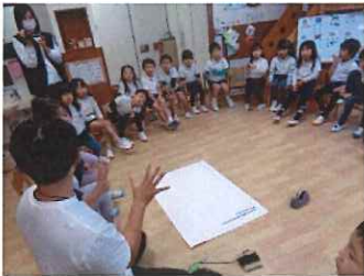
毛糸を使って調べよう