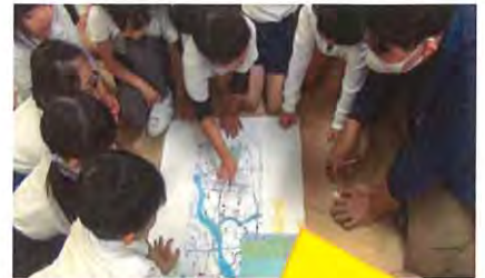
頑張って歩いたら行けるって お母さんが言ってた！