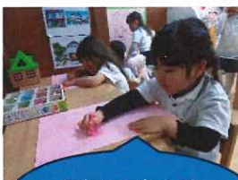
屋根は三角の形やったで！

散歩から帰ってきて家を描いてみました。レンガの家や赤い屋根の家、窓がたくさんの家など楽しい家がたくさん完成しました。