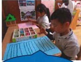
マンションにもドアあったな