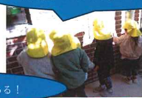
キッズに大きいドアある！