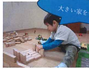
大きい家をつくらう！